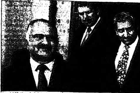
الأعضاء في مجلس النواب استمعوا لشهادات الخبراء حول تلوث المياه في الأردن.

مجلس النواب استمع لشهادات الخبراء حول تلوث المياه في الأردن، وتوقع فتح تحقيق قضائي ومحكمة المستشارين على تلوث المياه في الأردن. وتوقع فتح تحقيق قضائي ومحكمة المستشارين على تلوث المياه في الأردن.